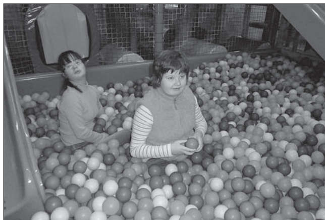
Z Jojo parku si žáci odnášejí neopakovatelné radostné prožitky.