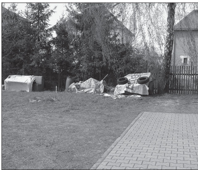
Rada pozemků je využívána protiprávně.