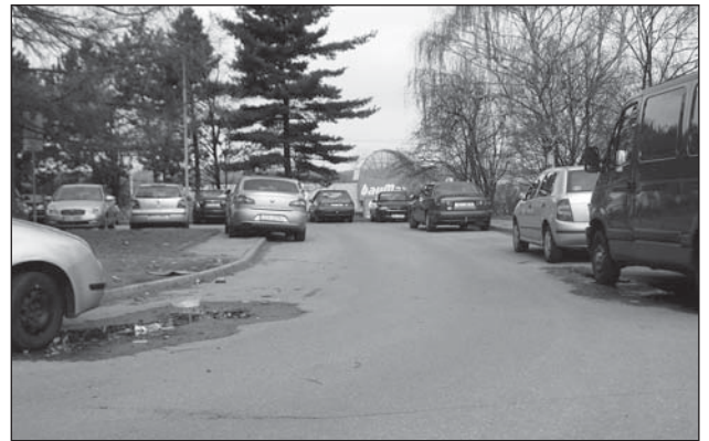
Špatně zaparkované auto může způsobit nehodu.